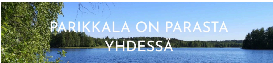
Parikkalan esiopetuksen opetussuunnitelma

Valtakunnallinen esiopetuksen opetussuunnitelma määrittelee, ohjaa ja tukee esiopetuksen järjestämistä, jota Parikkalan kunnan esiopetuksen opetussuunnitelma täydentää. Parikkalan kunnan täydentävä osuus on merkitty Parikkala-logolla. Kuntaan on laadittu yksi yhteinen suomenkielinen esiopetuksen opetussuunnitelma, jota toteutetaan jokaisessa kunnan esiopetuksen toimipaikassa. Parikkalan kunnan esiopetuksen opetussuunnitelma on hyväksytty sivistyslautakunnassa .2025. Valmis suunnitelma löytyy Opetushallituksen ePerusteista sekä Parikkalan kunnan verkkosivuilta ja siitä tiedotetaan huoltajia. Parikkalan esiopetuksessa laaditaan lukuvuosittain myös toimipaikkakohtainen esiopetuksen lukuvuosisuunnitelma, jossa tarkennetaan miten paikallista opetussuunnitelmaa toimipaikassa kyseisenä vuonna toteutetaan. Lukuvuosisuunnitelman keskeisistä asioista tiedotetaan huoltajia Daisy-sovelluksen kautta.