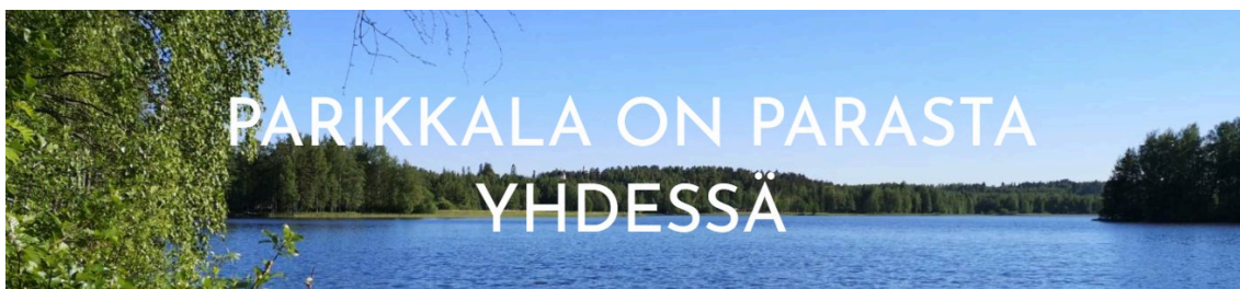
Parikkalan esiopetuksen opetussuunnitelma

Valtakunnallinen esiopetuksen opetussuunnitelma antaa hyvän pohjan esiopetuksen toiminnan suunnittelulle. Lisäksi suunnittelussa hyödynnetään lasten ja huoltajien kokemuksia ja mielipiteitä sekä mielenkiinnonkohteita pedagogisen suunnittelun lisäksi.